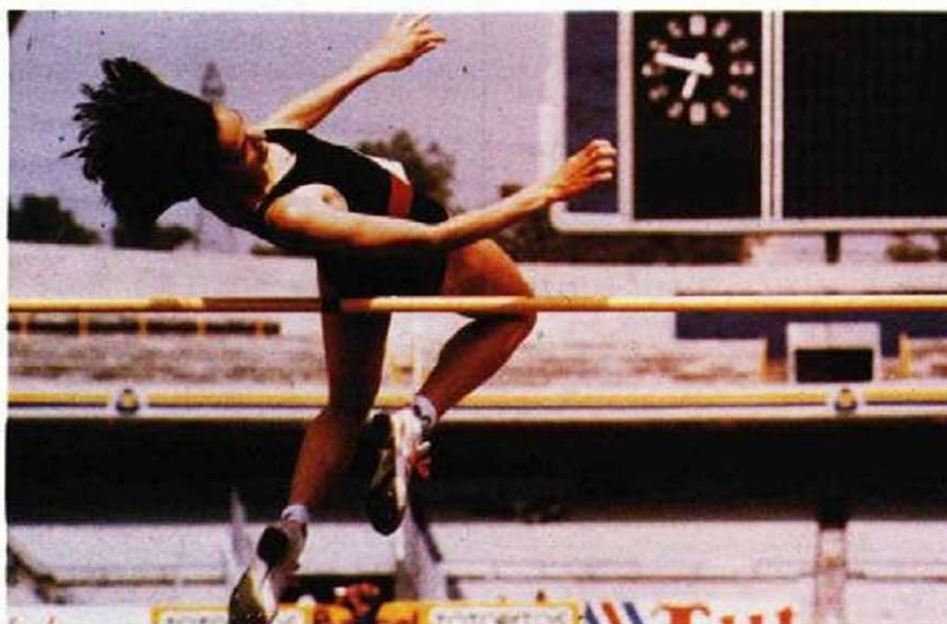
RJCAC: Récord de los Juegos Centroamericanos y del Caribe. / Central American Caribbean Record