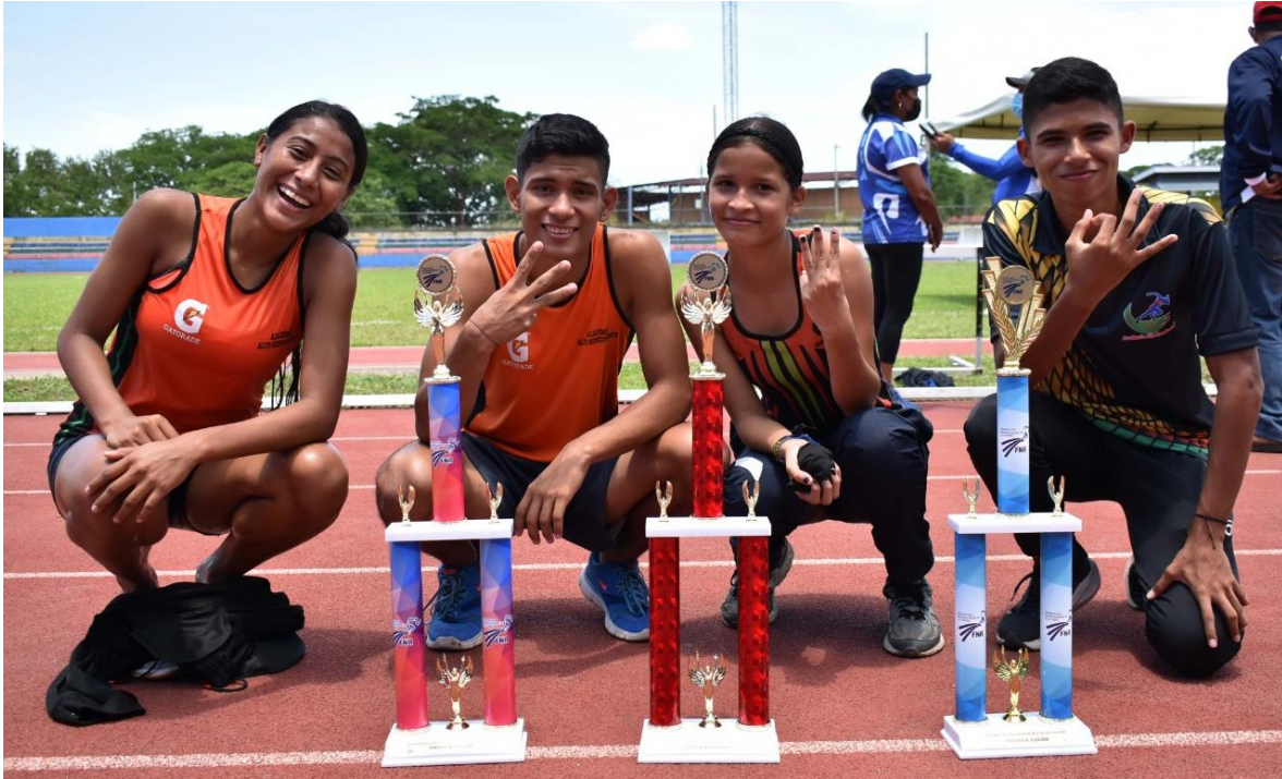
Academia de Alto Rendimiento.